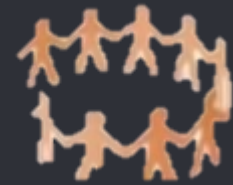
QUE NADIE SE QUEDE ATRÁS

La integración de políticas públicas significa equilibrar las dimensiones de desarrollo social, crecimiento económico y protección ambiental.